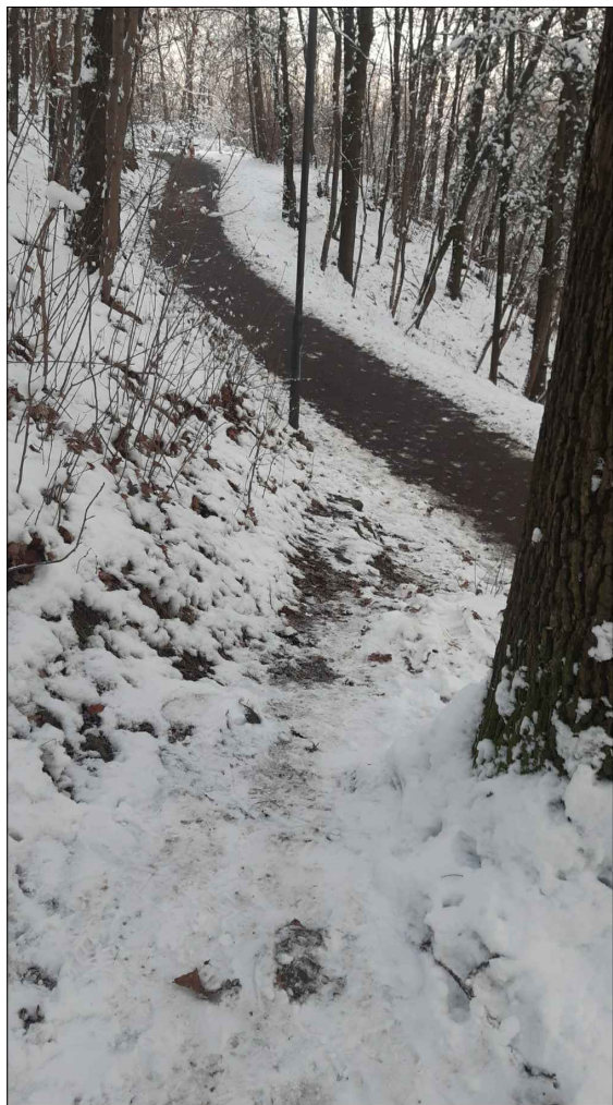
Pohled od kapličky na přístupovou pěšinu